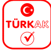
Şekil 1: TÜRKAK Logosu

TÜRKAK Akreditasyon Markası : TÜRKAK tarafından akredite edilmiş kuruluşların akreditasyon statülerini göstermek için kullandığı semboldür. Akreditasyon Markası TÜRKAK logosunun altına akreditasyon alanı, akreditasyona konu olan standardın numarası ve akredite edilmiş kuruluşun akreditasyon numarasının eklenmesi ile oluşturulur.