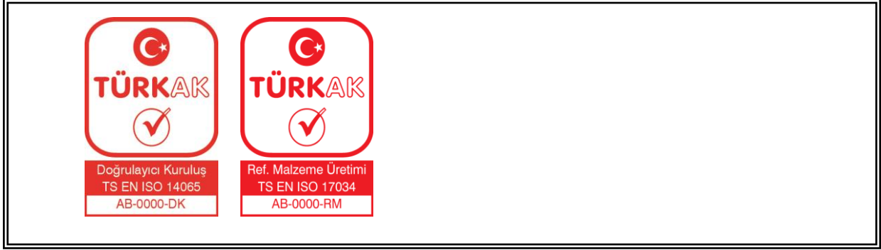
Şekil 5: TÜRKAK Akreditasyon Markası Örnekleri