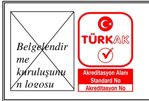
Şekil 6: Belgelendirme Kuruluşunun Logosu ve TÜRKAK Akreditasyon Markasının ilgili Sertifikada Kullanım Şekli